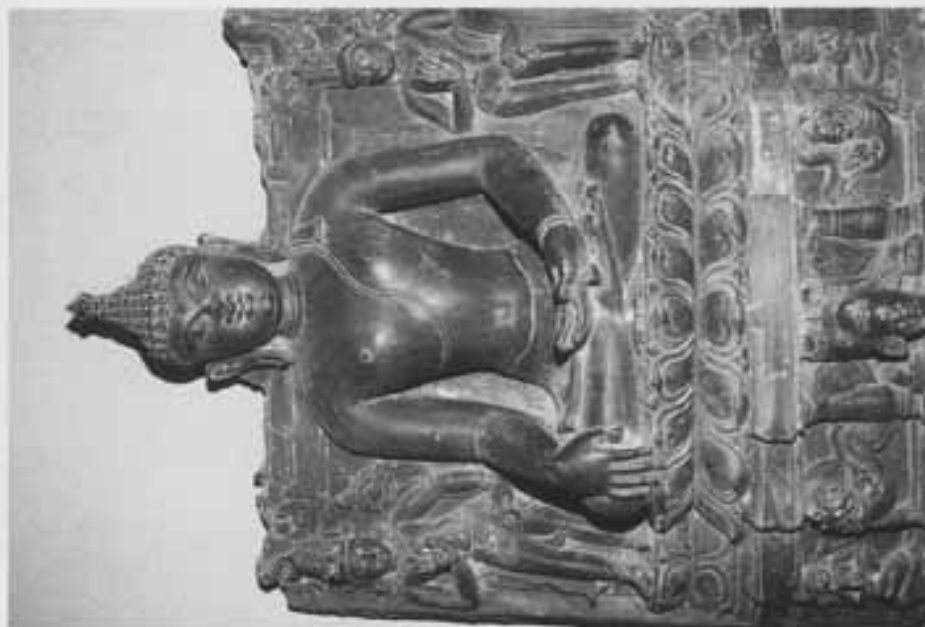
図12 脇侍菩薩をとる地持印仏坐像 (ヴァレンドラ博物館)