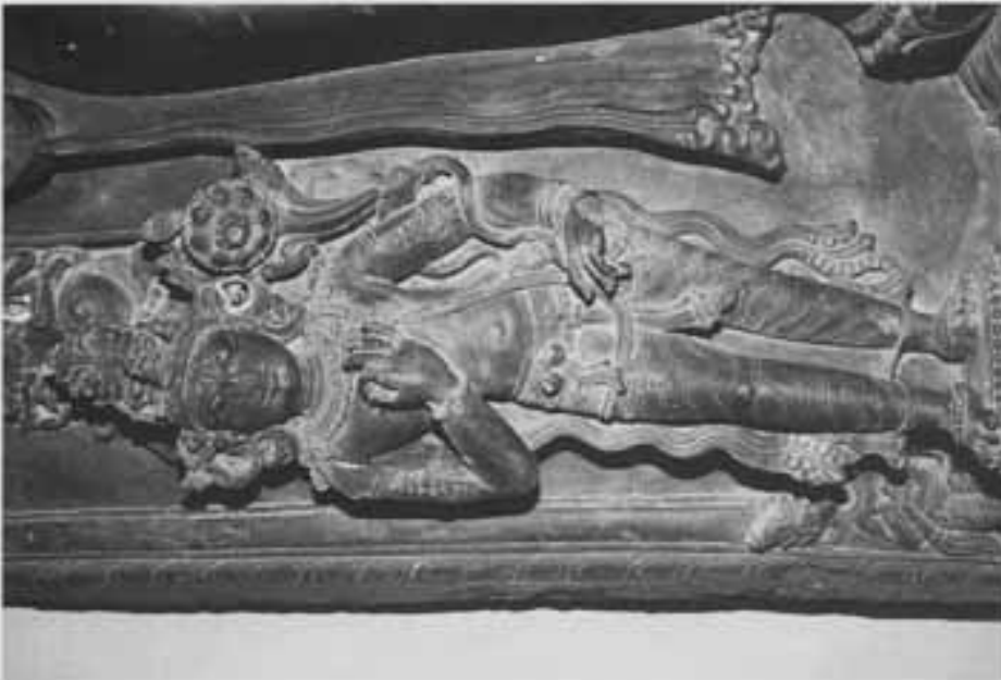
図17 図16部分(右脇侍の観音)