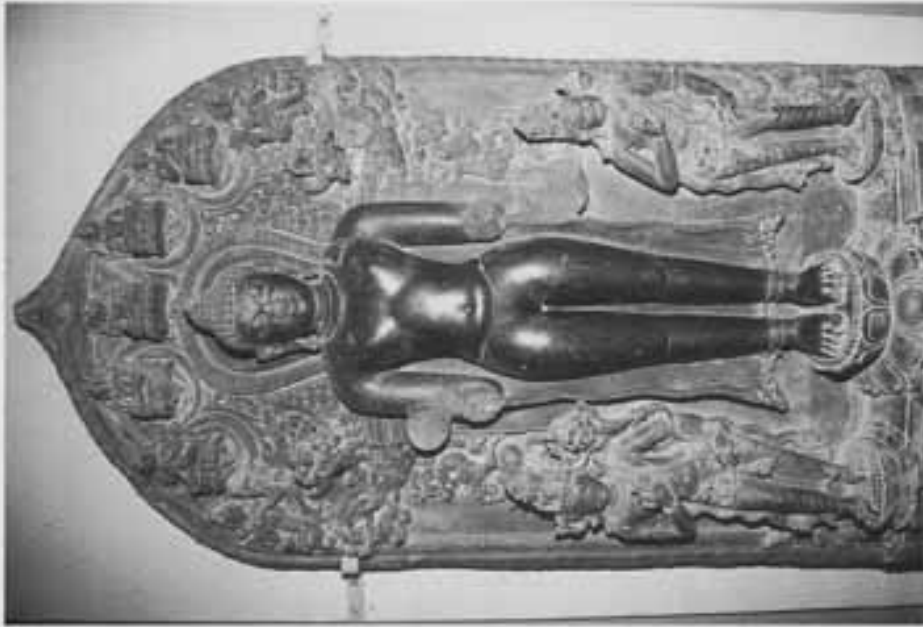
図16 脇持菩薩をとる高麗風印仏立像 (ヴァレンドラ博物館)