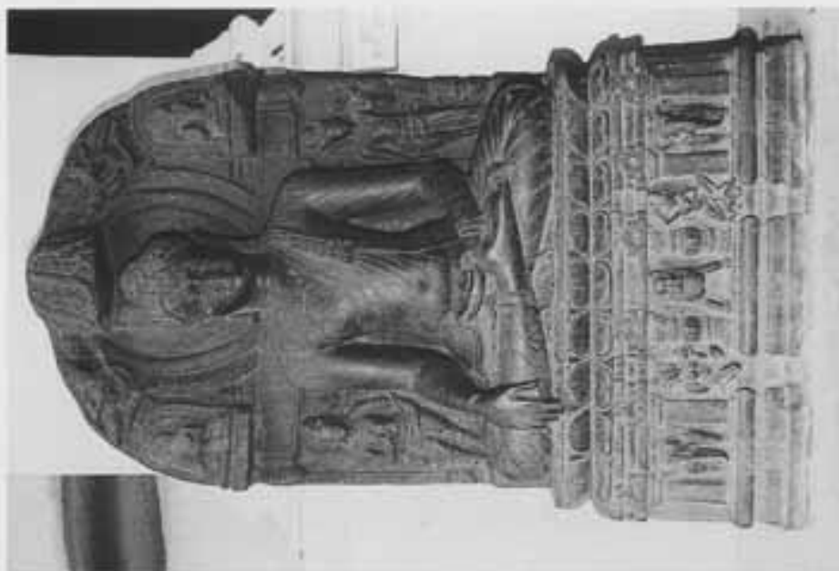
図6 脇侍菩薩をとる触地印仏坐像（インド博物館）