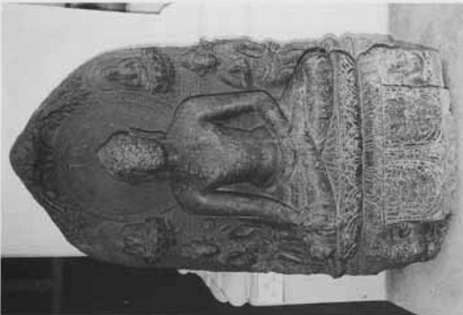
図9 脇侍菩薩をとる触地印仏坐像(インド博物館)