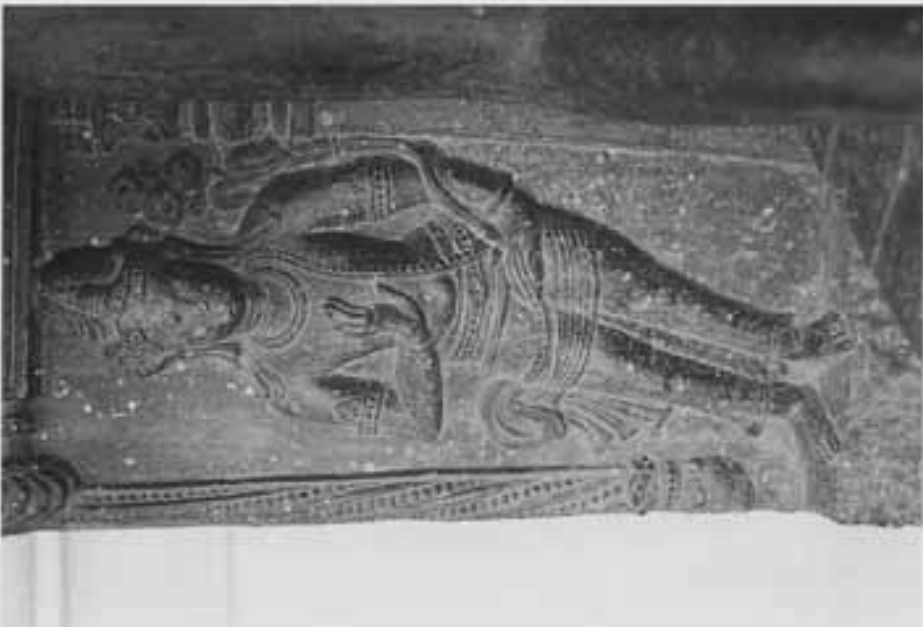
図7 図6部分 (右脇侍の弥勒)