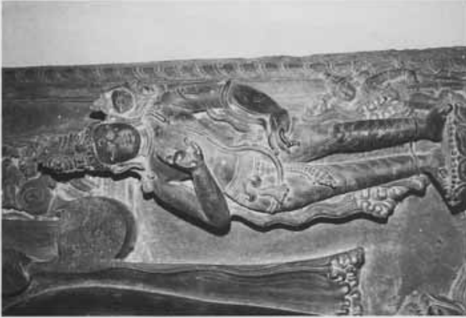
図16 図16部分(左脇侍の外観)