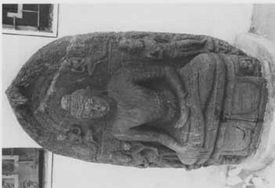
図5 脇侍菩薩をとる触地印仏坐像（ナールランダーン博物館）