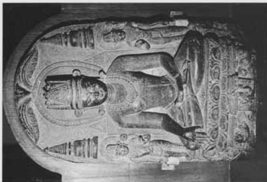
図19 脇侍菩薩をとる触地印宝冠仏坐像 (インド博物館)