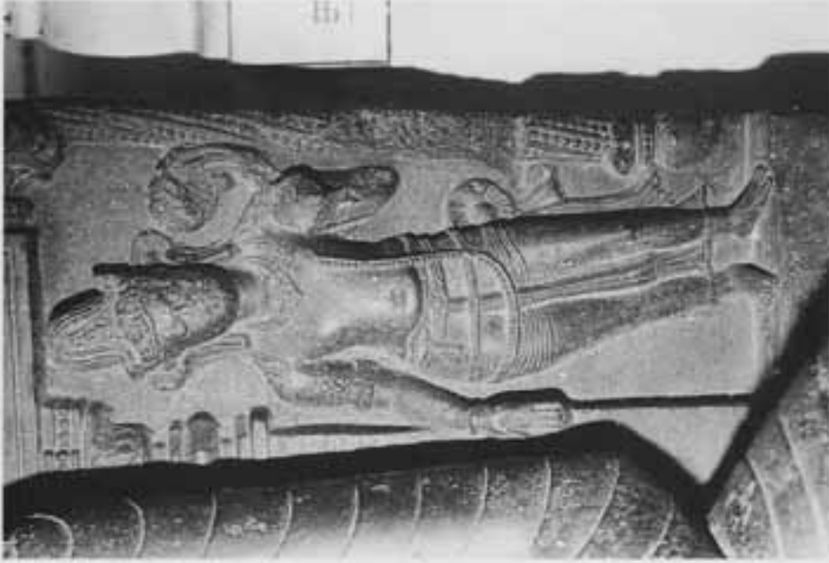
図6 図6部分 (左脇侍の観音)