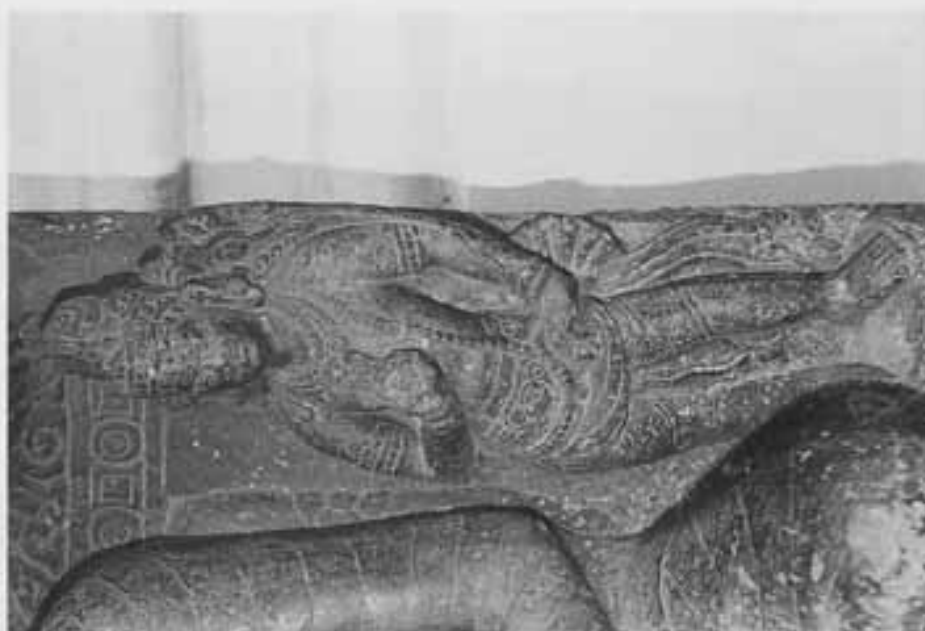
図11 図9部分 (左脇侍の弥勒)