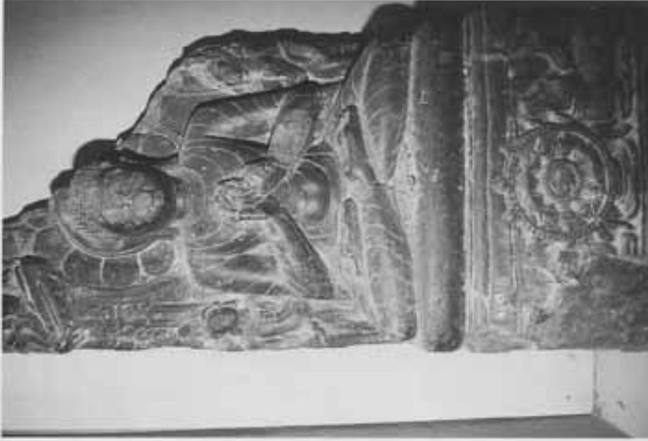
図14 脇侍菩薩をとる転法輪印仏坐像 (ヴァレンドラ博物館)