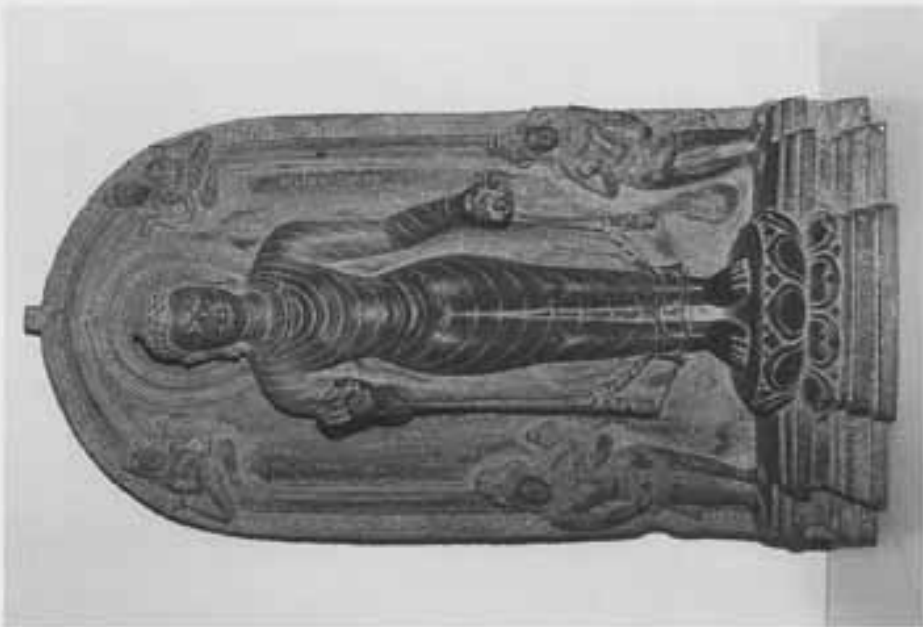
図15 脇持菩薩をとる高麗風印仏立像 (ナーランダー博物館)