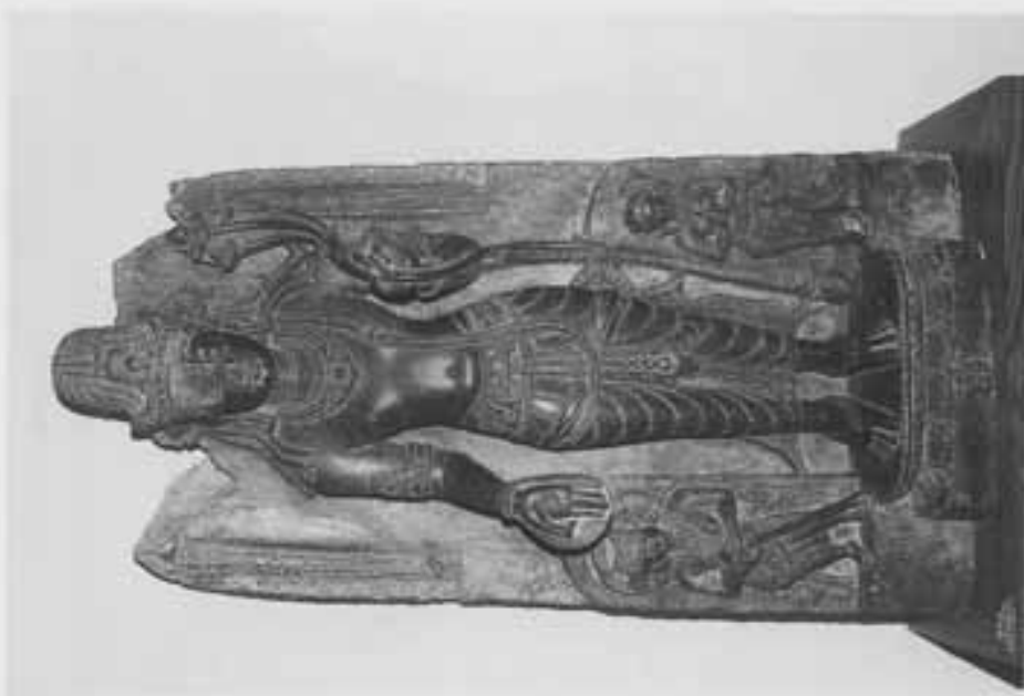
図3 両脇侍をとる弥勒立像(ネーデルラント博物館)