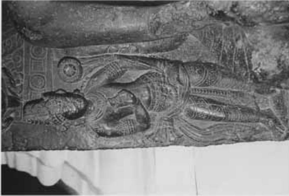
図10 図9部分(右脇侍の観音)