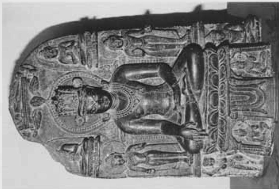
図20 宝冠触地印仏を主尊とし、脇侍菩薩をとる仏伝釈迦像 (バトナ博物館)