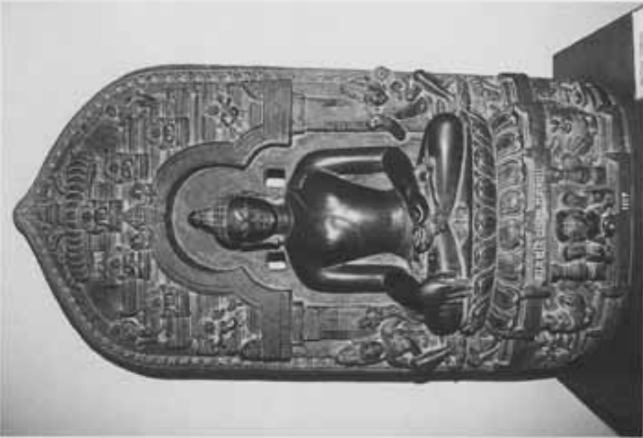
図13 脇侍菩薩をとる触地印仏坐像 (バンブラデシユ国立博物館)